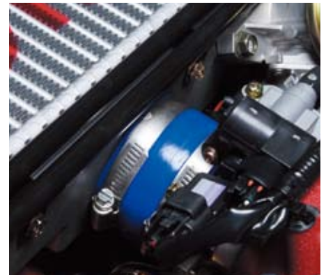
エアインテークホース装着 GDB インプレッサ STi インタークーラーの脱着がスムーズになります。