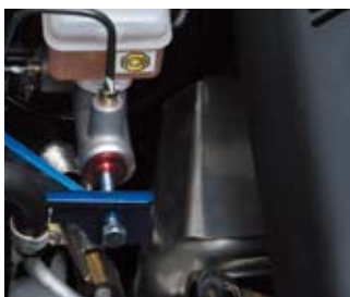
遮熱板装着 /BP5 レガシー