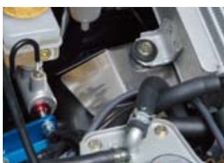
遮熱板装着 /GDB インプレッサ