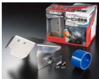
写真は遮熱板&ホースセット GDB 用

遮熱板装着 /GDB インプレッサ STi インタークーラーへの熱を効果的にカットします。