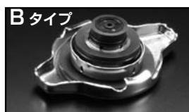
Bタイプ 商品コード：O0B 050 B13 税込価格：¥2,625 税抜本体価格：¥2,500 コードB