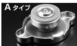
Aタイプ 商品コード：O0B 050 A13 税込価格：¥2,625 税抜本体価格：¥2,500 コードB