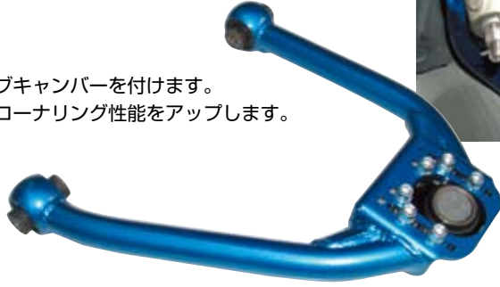
Z33 フェアレディZ装着時

■純正アッパーアームよりアーム長を短くしてキャンバー角をネガティブ方向に大きくします。