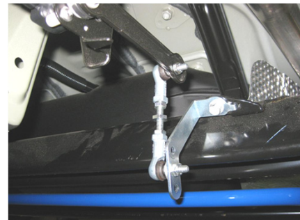
IA=ショート+ステー装着例