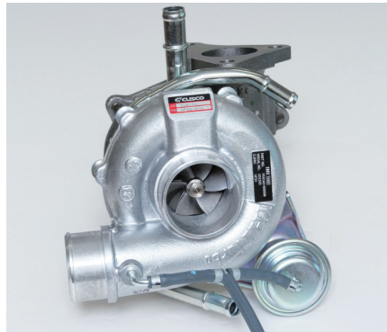
インプレッサ GDB 用イメージ