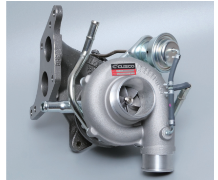
インプレッサ GRB,GVB 用イメージ