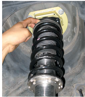
自主交換対象品 エステイマ・ACR30装着状態