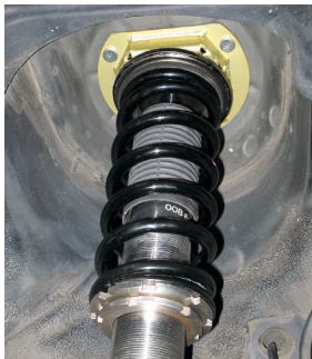
現行品 エステイマ・ACR30装着状態