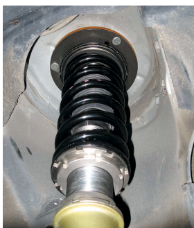
現行品 ボクシー・AZR60装着状態