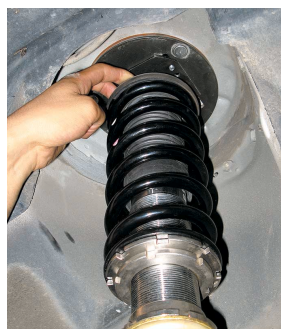
自主交換対象品 ボクシー・AZR60装着状態