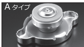
A タイプ 商品コード: 00B 050 A13 税抜価格: ¥2,500