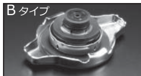
B タイプ 商品コード: 00B 050 B13 税抜価格: ¥2,500

注意 本製品は純正ラジエーターキャップより圧力を高く設定しています。車輛故障の原因となりますので、ラジエーターホース、ラジエーターヒーターホースが劣化及び損傷した状態のまま取付は絶対しないでください。