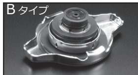
B タイプ 商品コード: 00B 050 B13 税抜価格: ¥2,500

注意 本製品は純正ラジエーターキャップより圧力を高く設定しています。車輛故障の原因となりますので、ラジエーターホース、ラジエーターヒーターホースが劣化及び損傷した状態のまま取付は絶対しないでください。