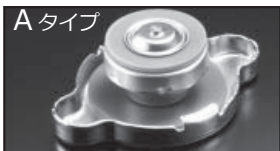
A タイプ 商品コード: 00B 050 A13 税抜価格: ¥2,500