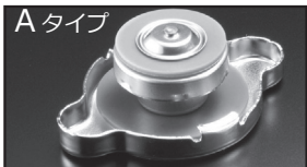
A タイプ 商品コード: 00B 050 A13 税抜価格: ¥2,500