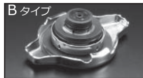
Bタイプ 商品コード: 00B 050 B13 税抜価格: ¥2,500

注意 本製品は純正ラジエーターキャップより圧力を高く設定しています。車輛故障の原因となりますので、ラジエーターホース、ラジエーターヒーターホースが劣化及び損傷した状態のまま取付は絶対しないでください。