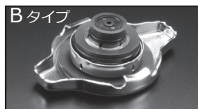
B タイプ 商品コード: 00B 050 B13 税抜価格: ¥2,500

注意 本製品は純正ラジエーターキャップより圧力を高く設定しています。車輛故障の原因となりますので、ラジエーターホース、ラジエーターヒーターホースが劣化及び損傷した状態のまま取付は絶対しないでください。