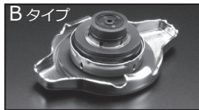
B タイプ コード B 商品コード: 00B 050 B13 税抜価格: ¥2,500

注意 本製品は純正ラジエーターキャップより圧力を高く設定しています。車輛故障の原因となり得ますので、ラジエーターホース、ラジエーターヒーターホースが劣化及び損傷した状態のまま取付は絶対しないでください。