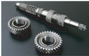
TOYOTA 86 & SUBARU BRZ 1ST & 2ND CLOSE RATIO GEARS

Real products will produce real results, only from Cusco.