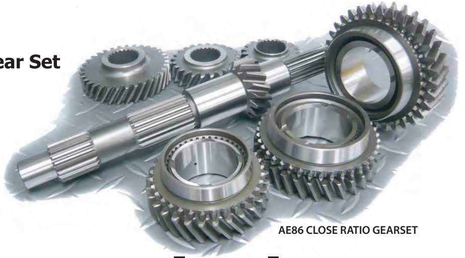
AE86 CLOSE RATIO GEARSET