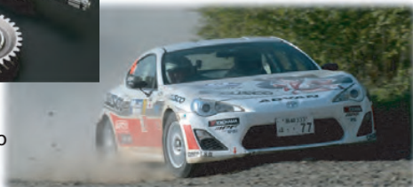
CUSCO ADVAN 86 2012 RALLY HOKKAIDO CLASS WINNER