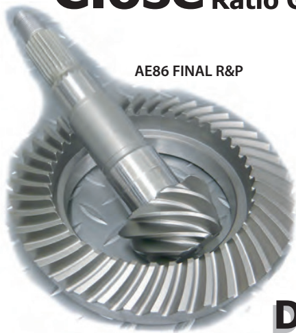
AE86 FINAL R&P