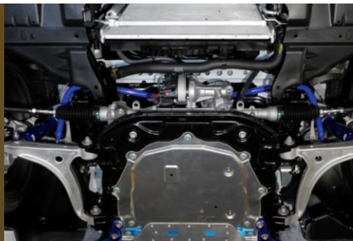
サスペンションパーツ