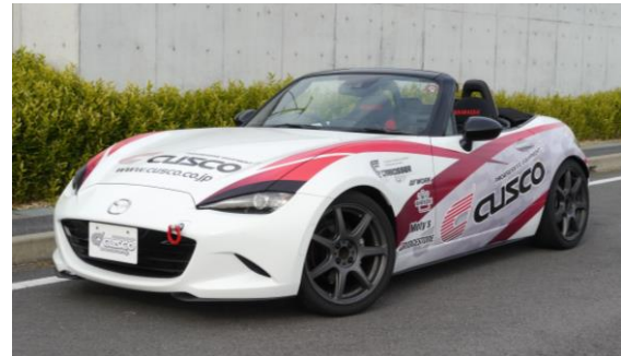
《適合車両》 ロードスター ND5RC (1.5L/6AT、NR-A)