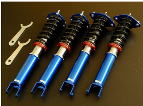
車高調整 サスペンションキット