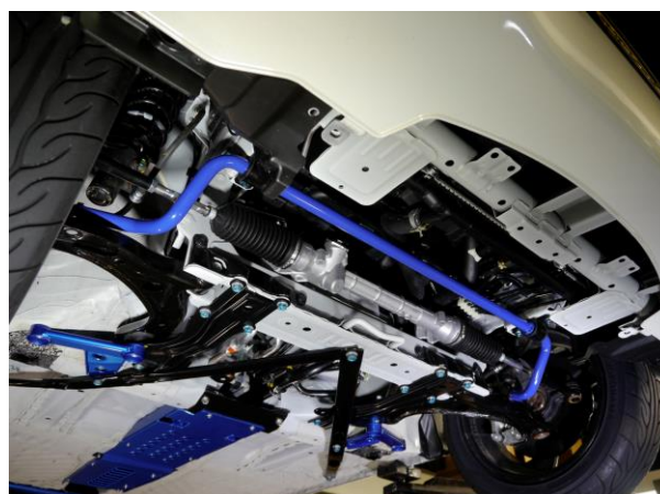
* フロント装着イメージ