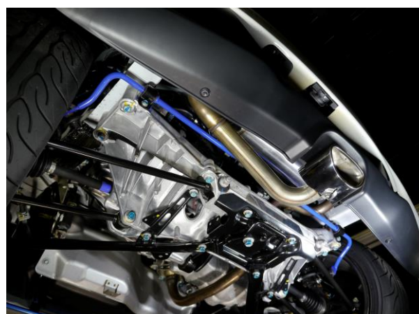
* リヤ装着イメージ