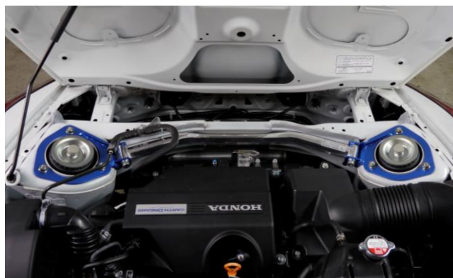
*リヤ装着イメージ

レバーロックを解除し、ナットを緩めます。ブラケットからシャフトだけを簡単に取外せます。