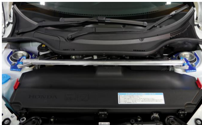
*フロント装着イメージ

ストラットバー / リヤストラットバー STRUT BRACE / REAR STRUT BRACE