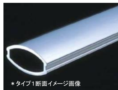
*タイプ1断面イメージ画像