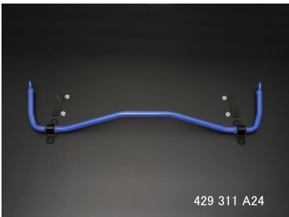
429 311 A24