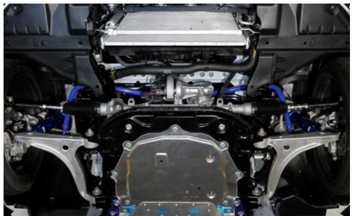
* フロント装着イメージ