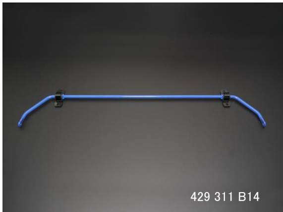
429 311 B14