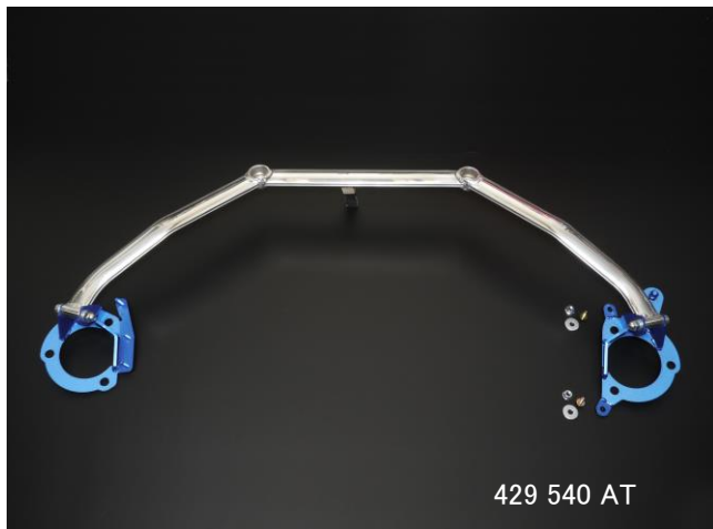
429 540 AT