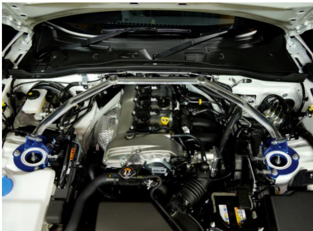
*フロント装着イメージ