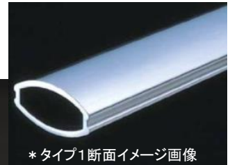
*タイプ1断面イメージ画像