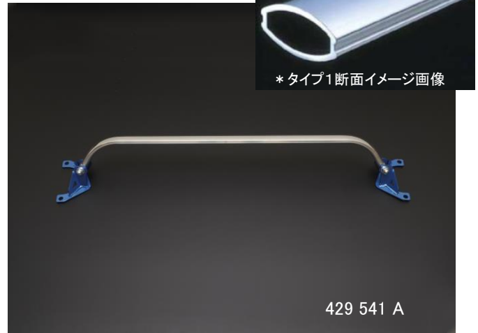
429 541 A