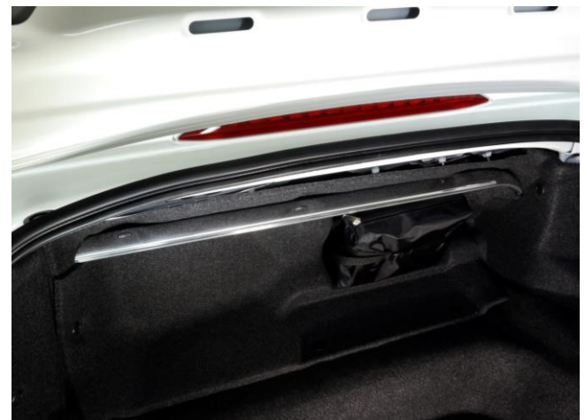
*リヤ装着イメージ