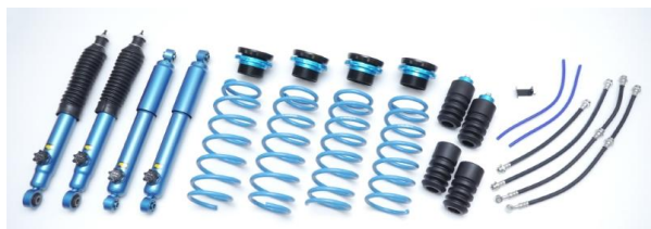
2インチアップサスペンションキット 商品イメージ

※ 本キット取付の際、クロスメンバーとプロペラシャフトが干渉する場合があります。詳しくは次ページ『ジムニー用サスペンションキット装着に関して』をご参照ください。