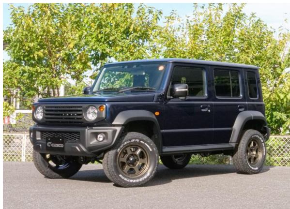
適合車両 スズキ ジムニーノマド JC74W