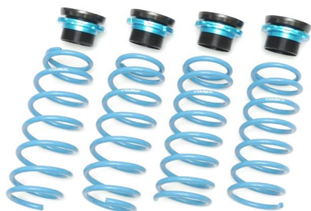
2インチアップスプリングセット 商品イメージ