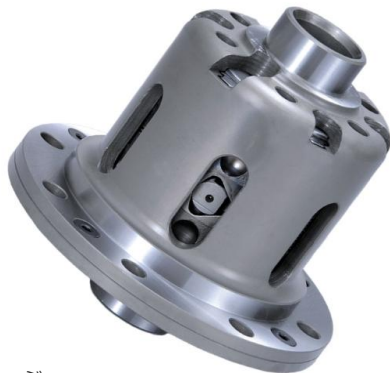
商品イメージ 実際の製品形状とは異なります