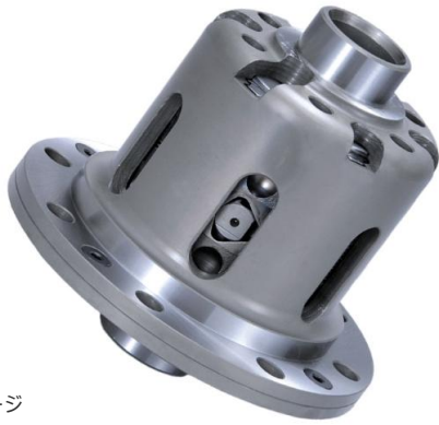
商品イメージ 実際の製品形状とは異なります