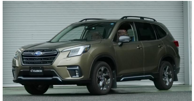
適合車両 スバル フォレスター SK5