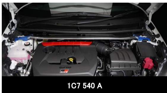
1C7 540 A