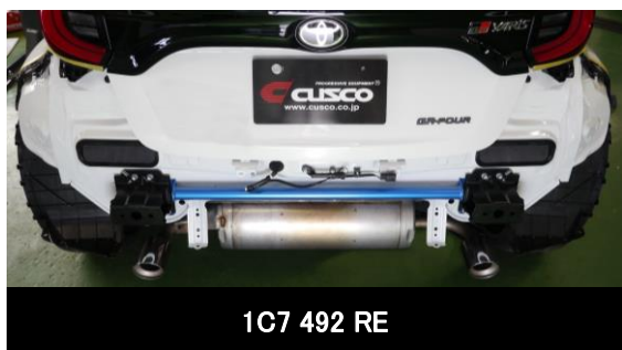
1C7 492 RE

《適合車両》 トヨタ GRヤリス GXPA16 (RZ/RC) / MXPA12 (RS)