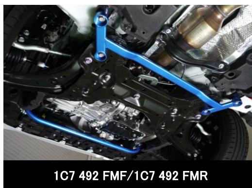
1C7 492 FMF/1C7 492 FMR