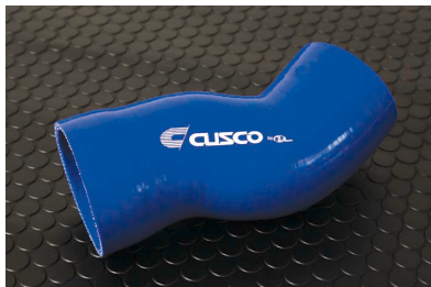
レガシーツーリングワゴン用インタークホース（開発中）

純正ホースと交換可能にする高いフィットティングを実現する車種別専用キット。リターンパイプやセンサー取付等のジョイントも純正機能を完全再現。純正品と置き換えるだけで、高強度、高耐久、高耐熱を發揮し、負荷の大きなチューニングにも対応します。