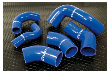
ランサーEvo.IX用ターボホース（開発中）