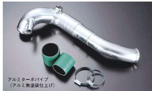
アルミターボパイプ (アルミ無塗装仕上げ)