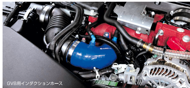
GVB用インダクションホース

吸気時のフリクションロスの低減とホースの膨張を抑え、ストレスのない吸気を可能にします。ターボ車ではブースト立ち上がり、NA車はアクセルレスポンスが向上します。純正エアインタークブーツの交換キットです。