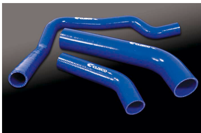
Evo.X用ターボホースキット