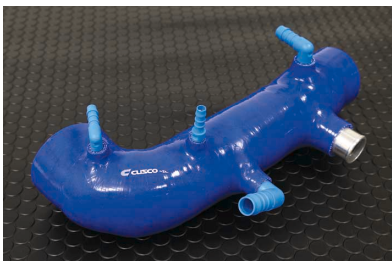
GRB用インダクションホース