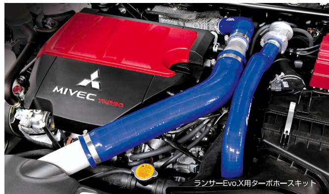
ランサーEvo.X用ターボホースキット

ターボ車の性能をフルに引き出すために高強度、高効率に仕上げた専用ホースキット。フラットな内部壁面によって、どんなパイプ形状でもスムーズな高効率吸気を実現。また、高ブースト時による変形、膨張を防ぐ積層構造を採用し、ホース抜けも抑制します。