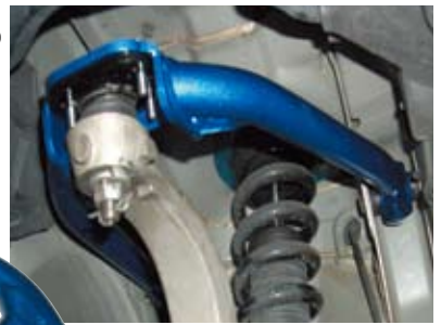
Z33 フェアレディZ装着時