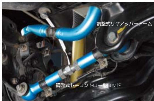
調整式リヤアッパーアーム