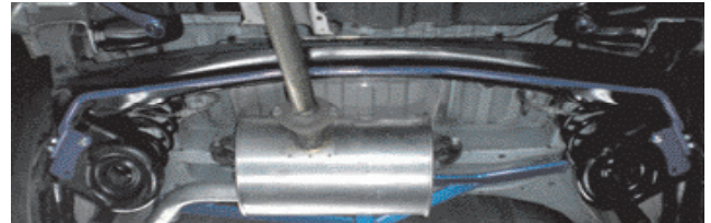
ノア (AZR60G 装着)