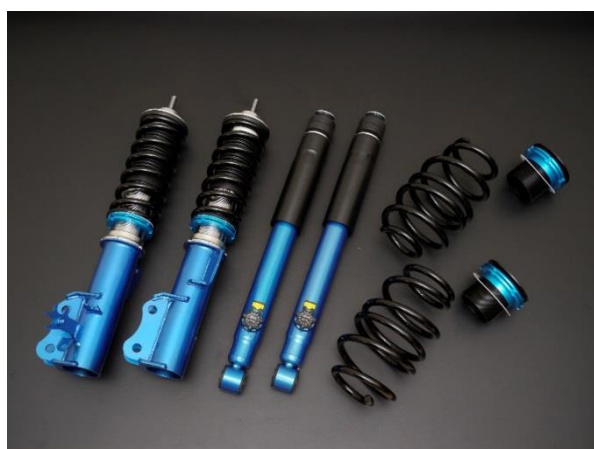
street ZERO 商品イメージ