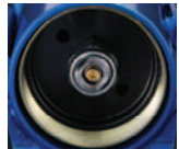
伸张方向 阻尼调节器（倒立式）