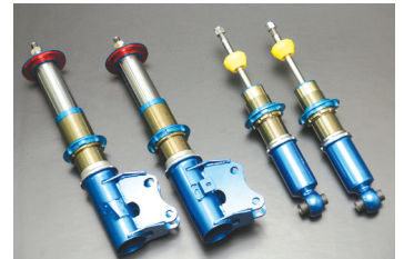
ジムカーナ、ターマック競技用 For Gymkhana, Tarmac Rally

*Pillow upper and competition mounts available