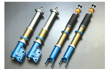
ダートトライアル、グラベル競技用 For Dirt Trial, Gravel Rally

Gymkhana & Gravel ZERO-3G ジムカーナ、ターマック競技用 For Gymkhana, Tarmac Rally