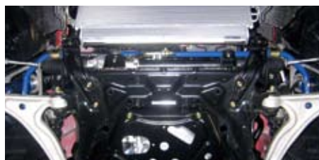
ロードスター(NCEC)(フロント)