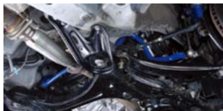
ハリアー(GSU30)(フロント)