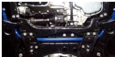
コーラ ルミオン(ZRE152N)(フロント)