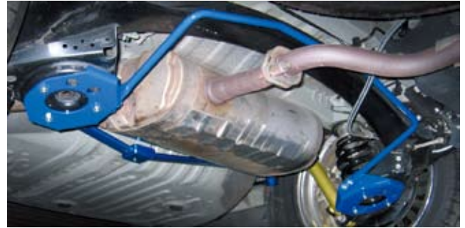
エスティマ (ACR50 装着)