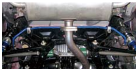
ロードスター(NCEC)(リヤ)