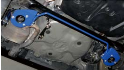
ヴィッツ (NCP91 装着)