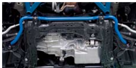
シビック(FD2)(フロント)