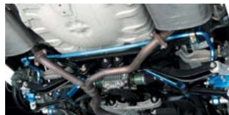
レガシィツーリングワゴン(BP5)(リヤ)