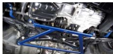
ヴィッツ(NCP91)(フロント)