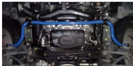
アリスタ(JZS161)(フロント)