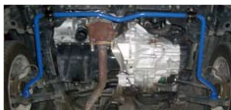
スイフトスポーツ(HT81S)(フロント)