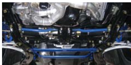
インプレッサ(GDB)(フロント)