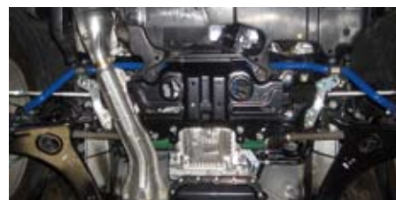
フォレスター(SH5)(フロント)