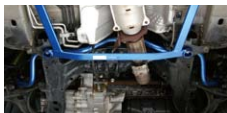
オデッセイ(RB1)(フロント)