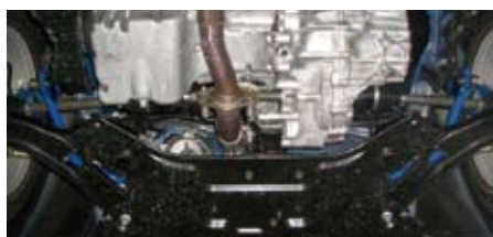
スイフトスポーツ(ZC31S)(フロント)