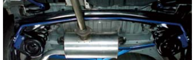
ノア (AZR60G 装着)