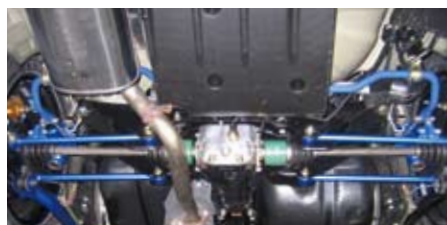
インプレッサ(GDB)(リヤ)