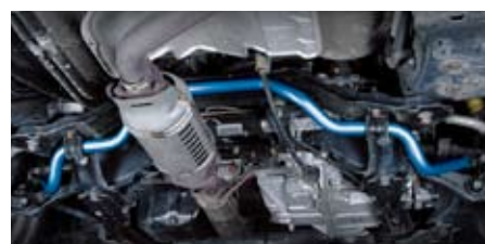
オデッセイ(RA6)(フロント)