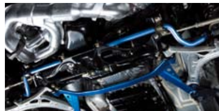
レガシィツーリングワゴン(BP5)(フロント)