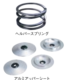
ヘルパースプリング