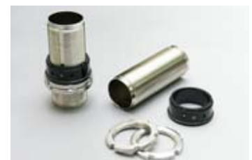
ノーマル形状用車高調整ネジ部 (スチール)