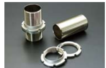
車高調整ネジ部 (スチール)