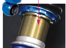
サビに強く固着しにくい 特殊コーティングの調整部