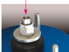
新開発・ニードルバルブ 減衰力24段調整部 (ウィッシュボーン式正立タイプ)