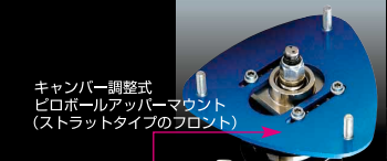
キャンバー調整式 ピロボールアッパーマウント (ストラットタイプのフロント)