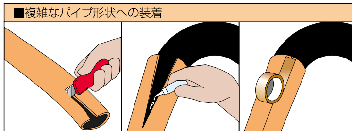
■複雑なパイプ形状への装着 ロールバーパッドを縦割りにする。パイプに巻き付け瞬間接着剤が両面テープで固定する。アセテートテープで継ぎ目を仕上げる。