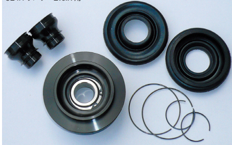
CZ4A ランサー Evo.X 用