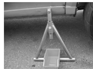
市販のトレイをパーツトレイとして取り付けることもできて便利