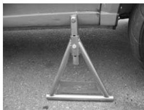
WR カータイプリジットラック取付時