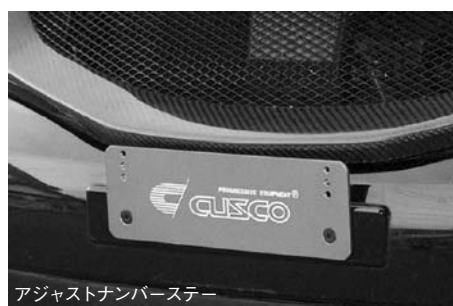
アジャストナンバーステー