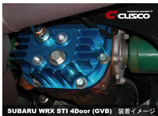
SUBARU WRX STI 4Door (GVB) 装着イメージ

使用大容量差速器外壳盖可以使润滑油的容量在原厂容量的基础上实现400CC UP!! 在运动性驾驶以及竞技赛事中使用时, 大容量的润滑油可以有效地保护LSD以及各种齿轮。对抑制润滑油温度上升也所有显著的效果。