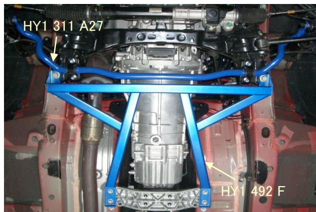
前平衡杆 底盘加强件 安装图