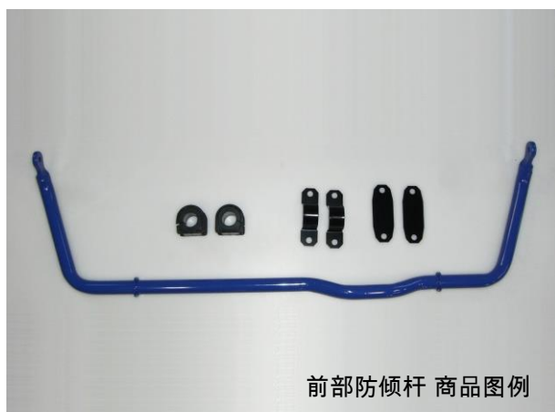
前部防倾杆 商品图例