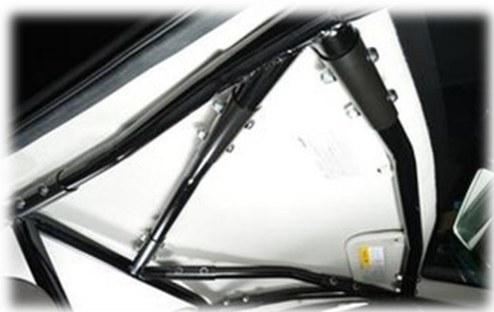
安装图例的车辆为PROTON Satria Neo