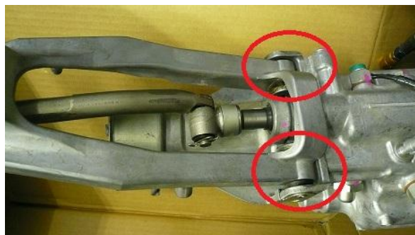
※换挡杆保持架衬套安装部分