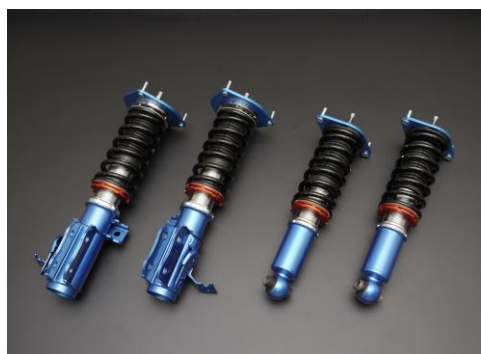
车高调整式避震器