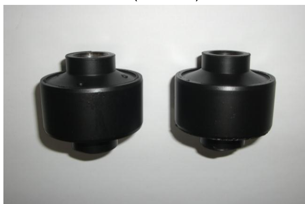
＜＜适合车辆＞＞ 丰田 86 ZN6 / 斯巴鲁 BRZ ZC6