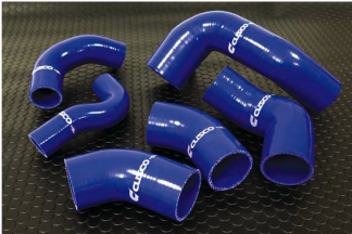
Evo. VII/VIII 涡轮硅管套件