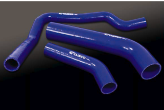
Evo. X 涡轮硅管套件